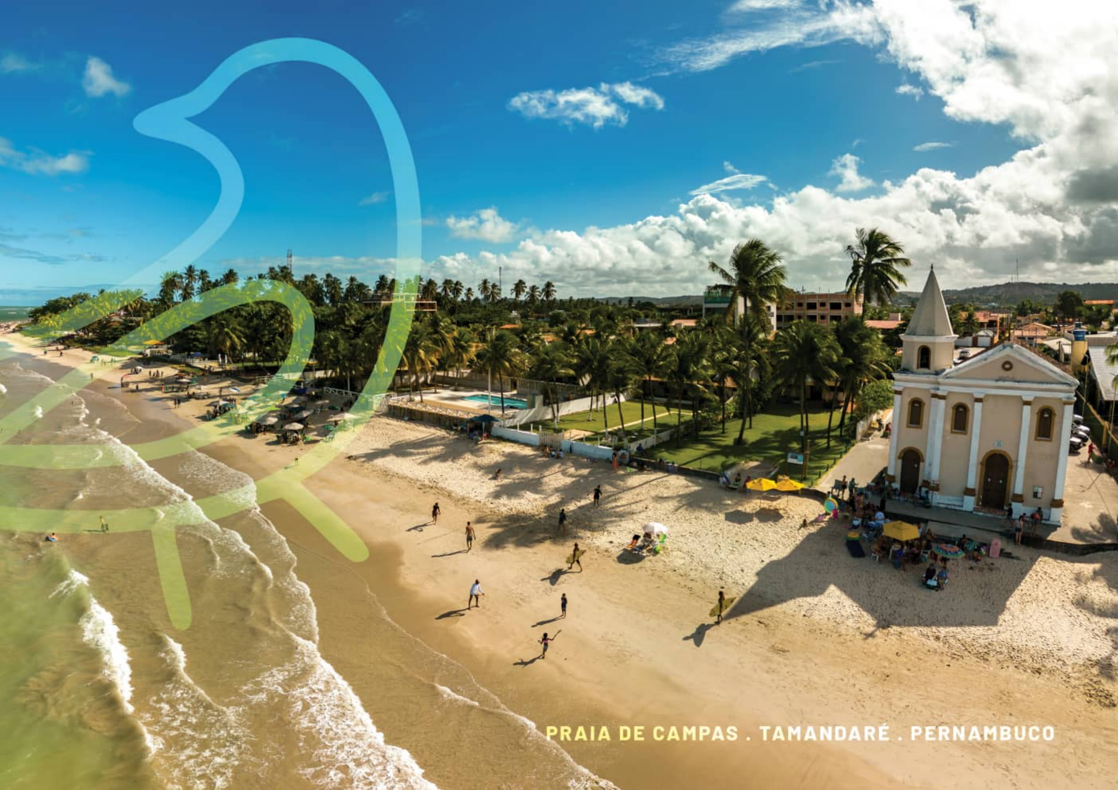
PRAIA DE CAMPAS . TAMANDARÉ . PERNAMBUCO