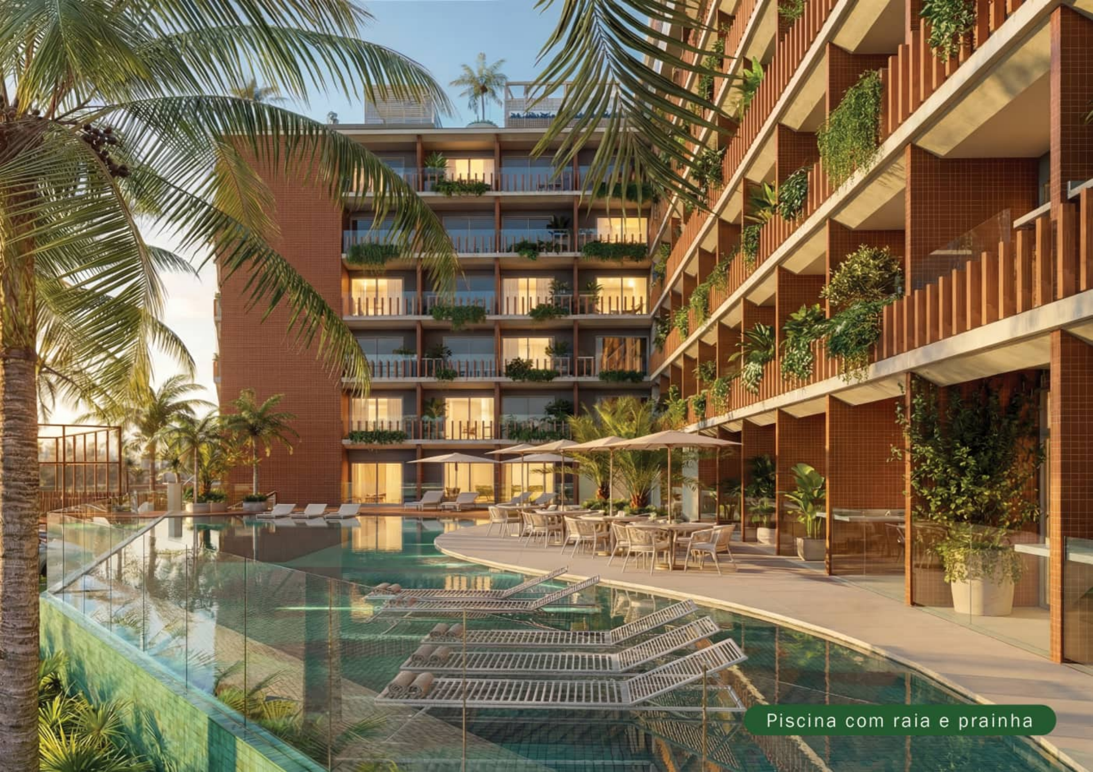
Piscina com raia e prainha